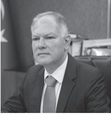
Büyükelçi (E) Selim Yenal İcra Komitesi Başkanı